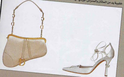
مجموعة سادل (SADDLE) من ديور (DIOR)