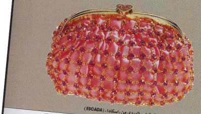
Chaque année de la saison et le printemps de la saison (FSCADA)