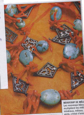
BEAUCOUP DE MÉLANGES Les nouveaux bijoux fantaisie multiplient les mélanges minéraux, métaux, plastiques, verre, cristal s'associent de jeux complexes de couleurs. (Boc)