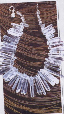
IL N'Y A PLUS DE SAISONS. Le cristal, le corail ou la turquoise traditionnellement estivaux sont de plus en plus employés pour l'hiver. (Elena Cantacuzène)

ommatiques de cette envie de bijoux, se voient aux coloris de peau (Vivianne) ou encore les grosses manchettes en métal noires, strassées de notes de champagne, couvrant la moitié du bras. Philippe Audibert, très remarqué par Lagerfeld Gallery. En général, on trouve des sautoirs de rivière noires, foncées en lais, dans des tons de gris et de noir, pour des lignes sobres, à enrouler de près à porter. Les pièces de tendances du prêt-à-porter. Les pièces sont toujours volumineuses, mais les formes plus légères.